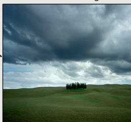
Cooling Level 2