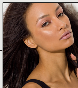
Warming Level 2