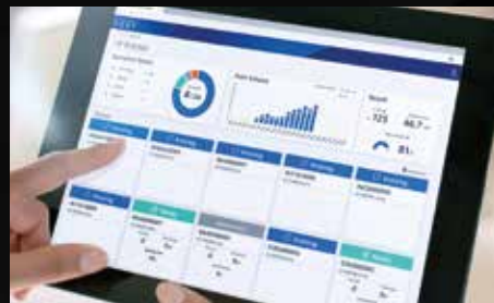
Epson Cloud Solution PORT

La alta calidad de imagen se consigue gracias a tres tecnologías de impresión de Epson: Halftoning, LUT totalmente optimizadas y Micro Weave, que reducen la granulación y el efecto banding. La tecnología de control de calentamiento y curado, combinada con el cabezal de impresión PrecisionCore de larga duración, proporciona una fiable uniformidad de color en toda la tirada. Esto evita la necesidad de reimpressiones debido a colores desiguales.