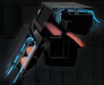
Calefactor con diseño antipolvo