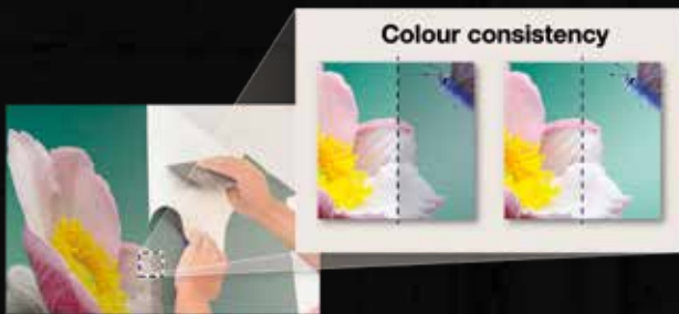
Uniformidad del color